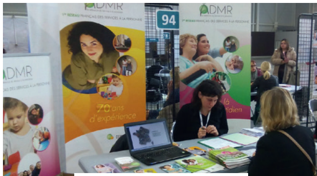
Le stand de l'ADMR au forum de l'emploi et de la formation

L'ADMR 22 a ouvert un compte Twitter : @ADMR_22. N'hésitez pas à nous suivre et à nous adresser des photos et articles de presse concernant vos réalisations locales, afin que nous puissions relayer l'information sur le web.