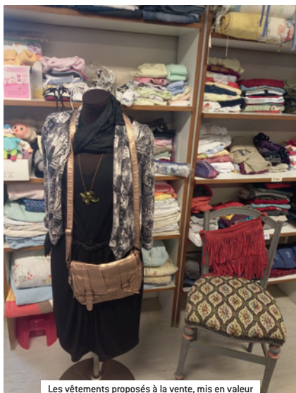
Les vêtements proposés à la vente, mis en valeur par l'agencement réalisé par les bénévoles

Les bénéfices rapportés par la vente des vêtements servent au fonctionnement de l'association locale. L'association organise également des bourses aux vêtements : une en fin d'hiver pour les vêtements de la saison printemps/été et une autre en fin d'été pour les vêtements d'hiver.