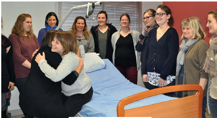
Les stagiaires en pleine démonstration d'aide au lever

Pour faciliter leur disponibilité, un accueil des personnes malades est prévu tout au long de la formation. Une dizaine de personnes participe aux 5 demi-journées de formation organisées entre mars et mai. Une seconde session aura lieu entre octobre et novembre.