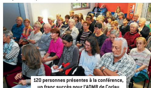
120 personnes présentes à la conférence, un franc succès pour l'ADMR de Corlay

Elle s'est appuyée sur deux documentaires qu'elle a réalisés dans les locaux de l'ADMR pour montrer des techniques pour stimuler la mémoire : l'automassage et l'olfactothérapie. La rencontre s'est achevée avec la visite de l'accueil de jour en présence du personnel.