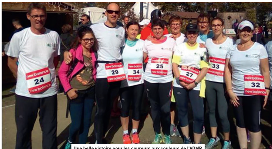
Une belle victoire pour les coureurs aux couleurs de l'ADMR