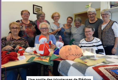
Une partie des tricoteuses de Plédran

C'est l'occasion de passer un bon moment convivial ensemble accompagné de quelques douceurs sucrées (faites maison) avec modération bien entendu... Et si l'activité du vendredi participait à une meilleure santé ?