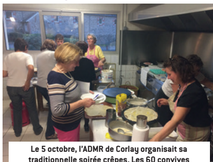
Le 5 octobre, l'ADMR de Corlay organisait sa traditionnelle soirée crêpes. Les 60 convives présents ont apprécié les crêpes préparées et servies par des bénévoles et des salariés de l'association.