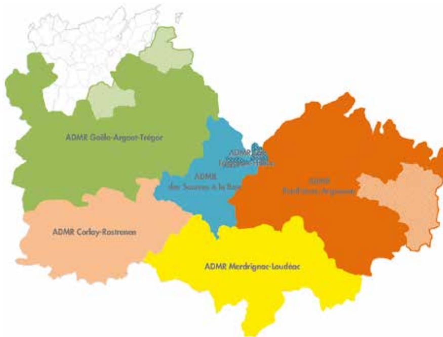
Carte des associations au 1 er janvier 2019