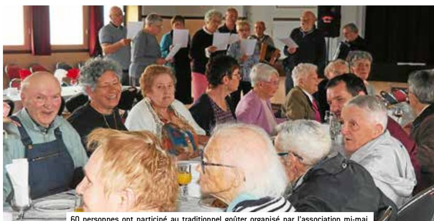
60 personnes ont participé au traditionnel goûter organisé par l'association mi-mai. Animé par la chorale des Murmures du Sulon, l'après-midi a permis aux personnes aidées de passer un moment convivial en compagnie des bénévoles et salariés de l'ADMR.